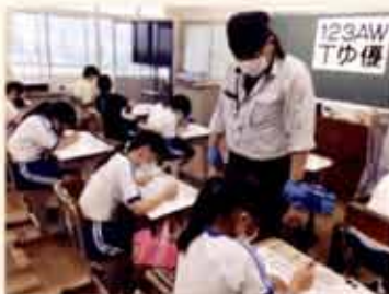
① 小学生の表札作り体験 （広告美術仕上げ職種）

「小中学校などの児童・生徒」や、「地域若者サポートステーションの支援対象となる方」へ、「ものづくりの魅力」を伝えます。体験することでものづくりへの興味を喚起し、マイスターの製作実演や講話で、マイスターの仕事や、体験した技能が仕事の中でどう活かされているかなどを学びます。